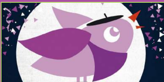
Gora Zorrotzako Jaiak 2017! (8)