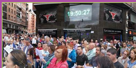
Zorrotzako auzokideon gaitzespena, eraso matxisten aurka (11)